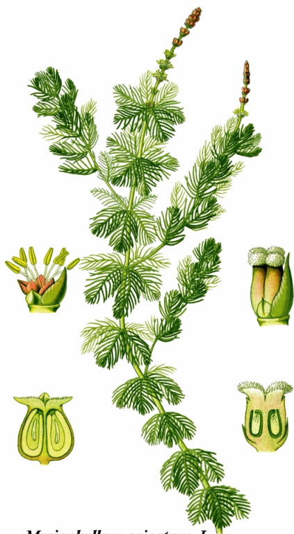
Myriophyllum spicatum L.

Les moyens de contrôle sont limités et peuvent s'avérer contre-productifs : par exemple, la coupe mécanique est inadaptée, car elle produit des fragments de tiges et participe ainsi à la propagation de la plante. Des débris de Myriophylle s'attachant fréquemment aux coques et hélices des bateaux, le nettoyage systématique des embarcations est favorisé par certains pour ralentir sa prolifération. L'installation de jute sur le fond du lac semble étouffer les herbiers, mais elle est coûteuse et peu faire face à des obstacles réglementaires.