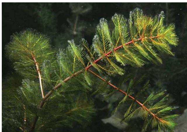
Plante avec ses feuilles subaquatiques en forme de plume