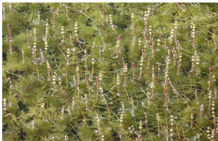
Plantes avec leurs épis émergents