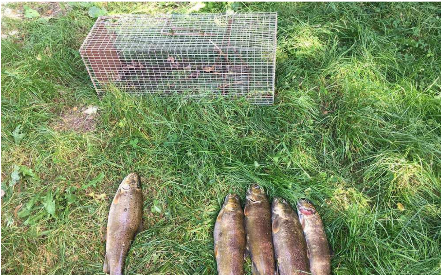
Cinq truites farios ont été reprises aux mains des braconniers de la Touvre

Depuis l'édition PDF de la Charente Libre du lundi 30 août 2017 page 05