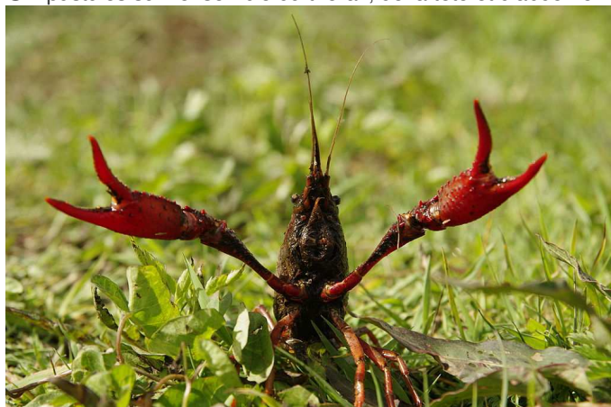
Position de défense