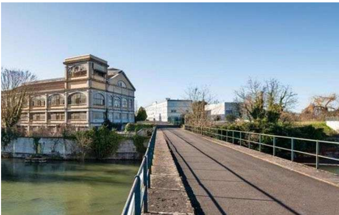
Le lotissement va pousser derrière l'emblématique bâtiment 87.

Il suffit de jeter un coup d'œil sur les perspectives en trois dimensions pour comprendre que la physionomie de l'ensemble ne sera pas conventionnelle. "J'ai voulu un projet en lien avec le paysage, développe Patrick CHAVANNES. J'ai développé une opération différente mais pas pour le plaisir d'être différente. Elle va s'intégrer dans un site très beau, celui des bords de la Touvre, un site de pêche à la truite, avec ses cascades, ses résurgences."