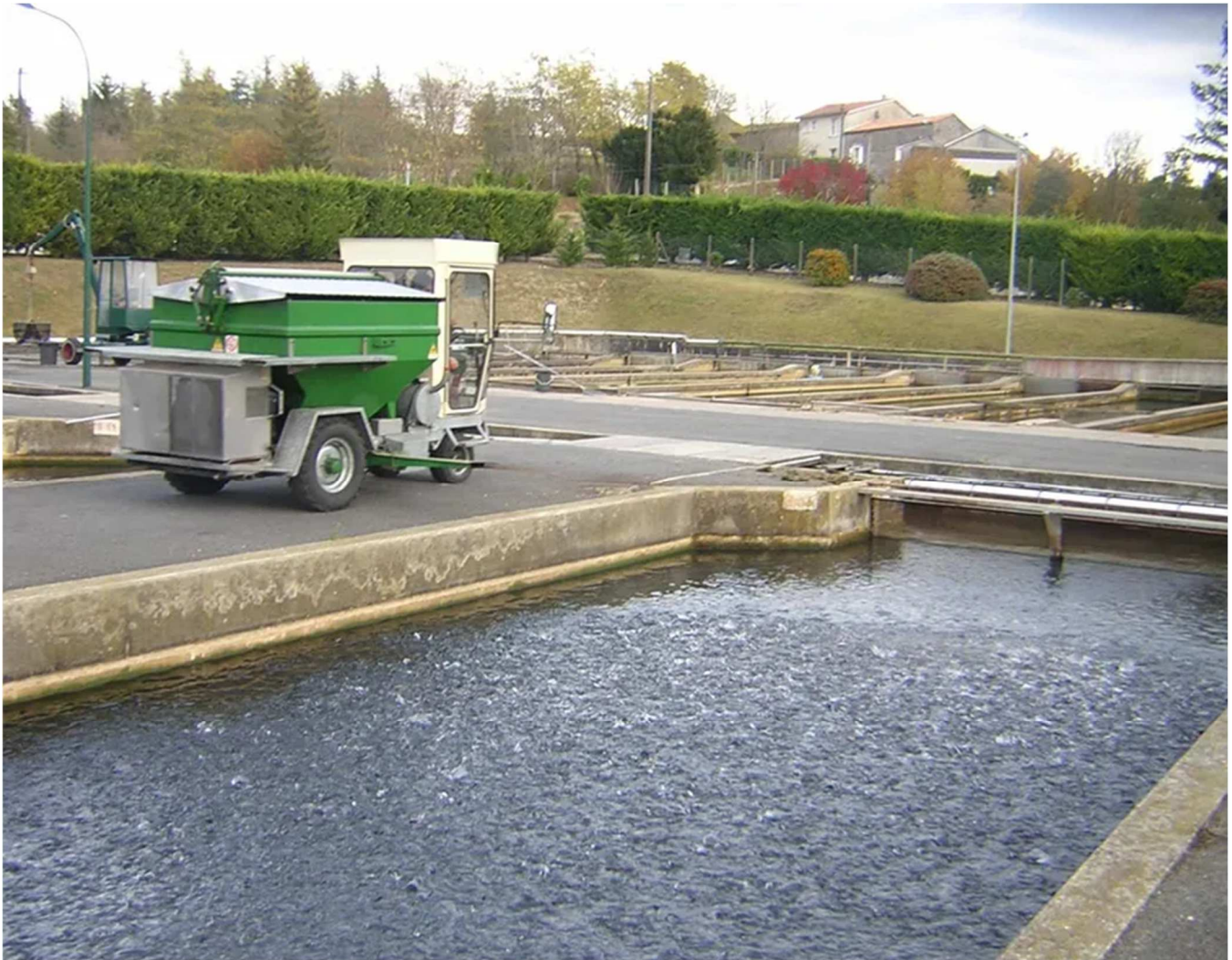
Les différents bassins de pisciculture

https://aappma-latruiresaumonee.net/wp-content/uploads/2022/03/2022-03-20-interview-Yann-Bellet-par-France-Bleu.wav